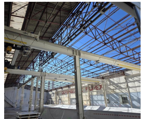
Dépose de la toiture - bâtiment 2