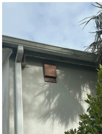
Façade Sud-Est - bâtiment 4